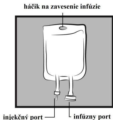
Obrázok 1: Vak