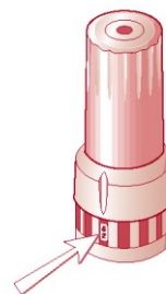
Obr. 4 Zatvorený inhalátor

Po ukončení inhalácie si vypláchnite ústa vodou alebo roztokom ústnej vody a obsah úst potom vyplňte bez prehĺtnutia. Toto pomôže zabrániť vzniku kandidózy v ústach.