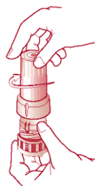
Obr. 3 Zatváranie inhalátora